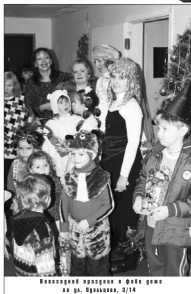
Новогодний праздник в фойе дома по ул. Удальцова, 3/14

Каждый прошедший год оставляет в нашей душе свои, неповторимые чувства. Если даже уходящий год сложился удачно, хочется непременно скорейшей встречи с годом НОВЫМ. Задолго до 31 декабря – такова натура россиянина – наряжаются елки. Одна другая краше, они и сегодня, по прошествии почти месяца, радуют детвору и взрослых: при входе во многие учреждения: большинству из нас не хочется расставаться с праздником, а вернее, с праздниками – с Рождеством Христовым и... Старым Новым годом.