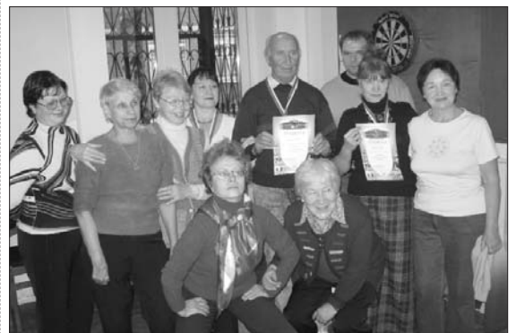
Подборку подготовили: Ирина Стрелкова, Вячеслав Веселов, Людмила Касперова Фото Ирины Стрелковой и Вячеслава Веселова

Мероприятие прошло весело. Глядя на его участников, невозможно было сказать, что собрались пожилые люди: настолько бодрый, жизнерадостный, по-молодецки задорный они были!