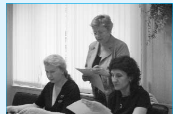
Депутаты муниципального Собрания принимают решения