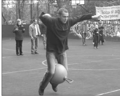
Объявление Уважаемые жители района Проспект Вернадского!

20 сентября выдалась теплая солнечная погода, по крайней мере, в первой половине дня, когда на площадке, расположенной по адресу: ул. Удальцова, 37, проходили соревнования «Всей семьей – за здоровьем».