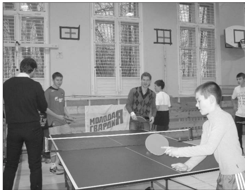
Теннисный турнир (в школе № 169)