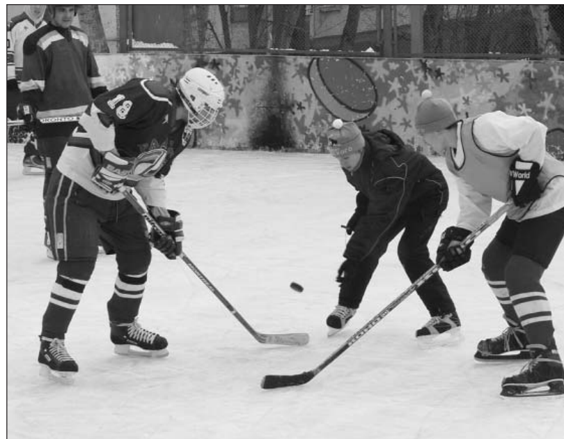
На спортивной площадке района