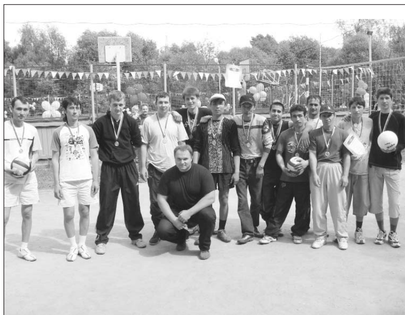
День физкультурника на спортивной площадке по ул. Удальцова, д. 4