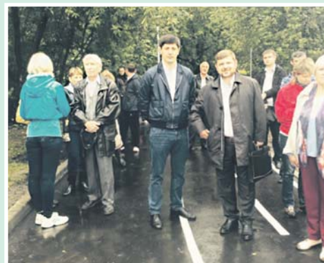
Колонки 2-й и 3-й полос подготовила участница событий Людмила КАСПЕРОВА