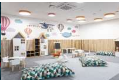
Просторный детский уголок