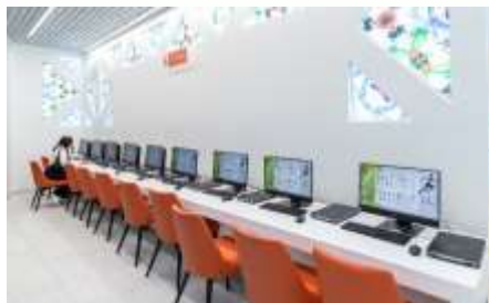
Расширенная зона электронных услуг