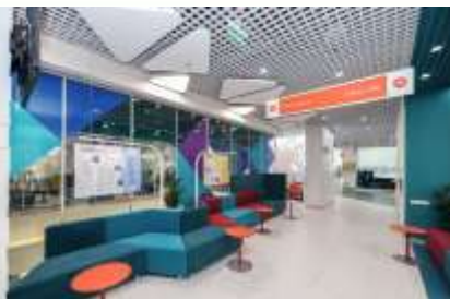
Большая площадь помещения