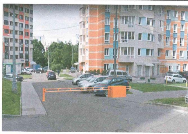
Шлагбаум антивандальный откатной автоматический, длина стрелы 4–6 метров.